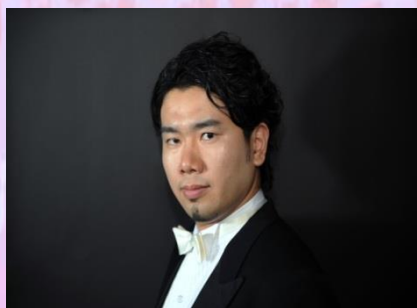
大島 嘉仁(バリトン)