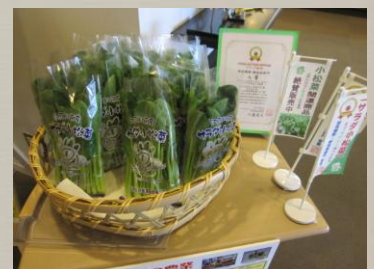
伝統工芸カフェ・アルティザンにて販売中

篠崎文化プラザ内の伝統工芸カフェ・アルティザンではそのサラダ小松菜を購入できます。他にも小松菜のうどん・そば・お菓子などの商品も販売していて、店内で召し上がれる小松菜を使ったカフェメニューもあります。図書館にお越しの際には是非お立ち寄り下さい。地元産の美味しい小松菜で元気になりましょう!