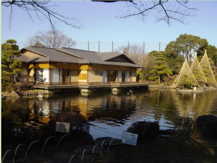
◆平成庭園 築山池泉回遊式庭園

江戸川区内のイベントやスポットを、スタッフが調査して身近な情報をお届けする、地域密着型のコーナーです。