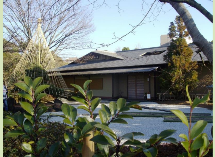
◆源心庵 数寄屋造りの純日本建築

公園の北側には「平成庭園」があり、築山池泉回遊式庭園として平成元(1989)年に完成しています。庭園の中には大きな池や昭和の俳人・石田波郷の句碑などがあり、中でも「源心庵」は数寄屋造りの純日本建築で、浮見堂形式で建てられた月見台が大きく池に張り出しており、ひときわ目を引きまします。池では大きな鯉が悠々と泳いでいて、それを眺めながらほつりを散策すると梅の花が咲き、流れる水の音が聞こえ、心が和