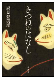
「魔」(「きつねのはなし」所収) 森見登美彦著 新潮社 Fモ 篠崎ほか所蔵

あのしとしと降る英国のような雨ではないのだ。無慈悲な、なにか恐ろしいものさを感じる。人はその中に原始的自然力のもつ敵意といったものを感じ得るのである。まるで大空の洪水だ。