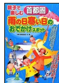
「親子で楽しむ首都圏雨の日寒い日のおでかけスポット」 子育て研究会ままーず著 メイツ出版 291.3カ 篠崎ほか所蔵

収録されている「雨の名前」の数はなんと422種類！ 雨に濡れ、いつもとは違う表情を見せる風景の写真とともに日本語の表現の多様さ、美しさを感じられます。