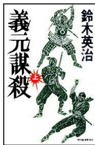
「義元謀殺」上下巻 鈴木英治著 角川春樹事務所 Fス1-2 篠崎ほか所蔵

雨の季節が近づいてきました。敬遠されがちな梅雨ですが、室内で雨音を聞きながら読書をするのも良いかもしれませんよ。今回は印象的な雨のシーンが登場する物語をご紹介します。