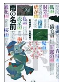
「雨の名前」 高橋順子文 小学館 451夕 篠崎ほか所蔵

収録されている「雨の名前」の数はなんと422種類！ 雨に濡れ、いつもとは違う表情を見せる風景の写真とともに日本語の表現の多様さ、美しさを感じられます。