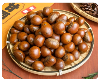
朝煎り甘栗 木守庵