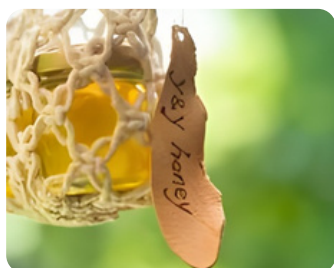
はちみつ y& honey