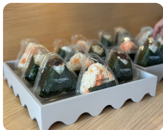
おむすび TEMARU OMUSUBI STAND