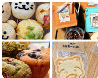
焼菓子、ハーブティー ひげぞ~のいえ 米粉のおやつファクトリー