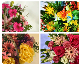
生花・アレンジメント Flower Livrer