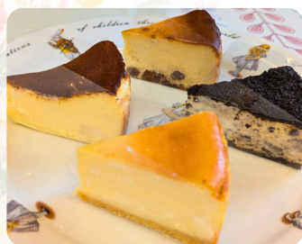
チーズケーキ ブルメリア