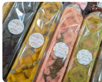
米粉ワッフル Cafe はなや香。