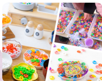
知的玩具 ホームラントーイ