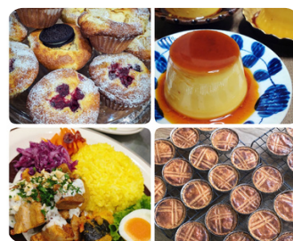
焼き菓子、弁当 niino bake shop