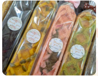
米粉ワッフル CAFE.はなや香。