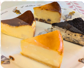
チーズケーキ プルメリア