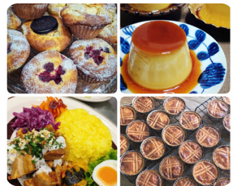
焼き菓子、弁当 niino bake shop