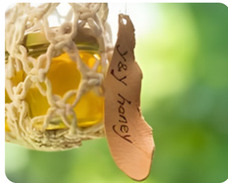
はちみつ y&y honey