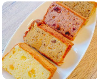
焼菓子 Cafe & Studio Petitgrain