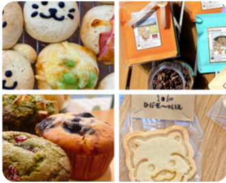
焼菓子、ドリップパックコーヒー ひげぞ〜のいえ 米粉のおやつファクトリー