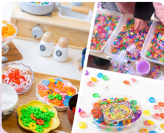
知育玩具 ホームラントーイ