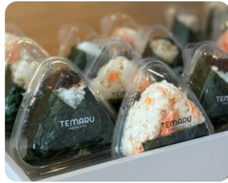
おむすび TEMARU OMUSUBI STAND