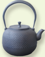
鉄分・ミネラル補給 〈江戸鉄瓶〉