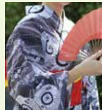
肌にやさしい天然素材 〈江戸浴衣〉