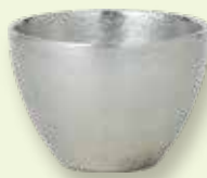
瞬時に器を冷却 〈純錫製食器〉