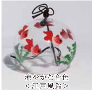
涼やかな音色 〈江戸風鈴〉