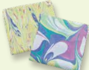
紫外線・冷房対策 〈墨流し染めストール〉