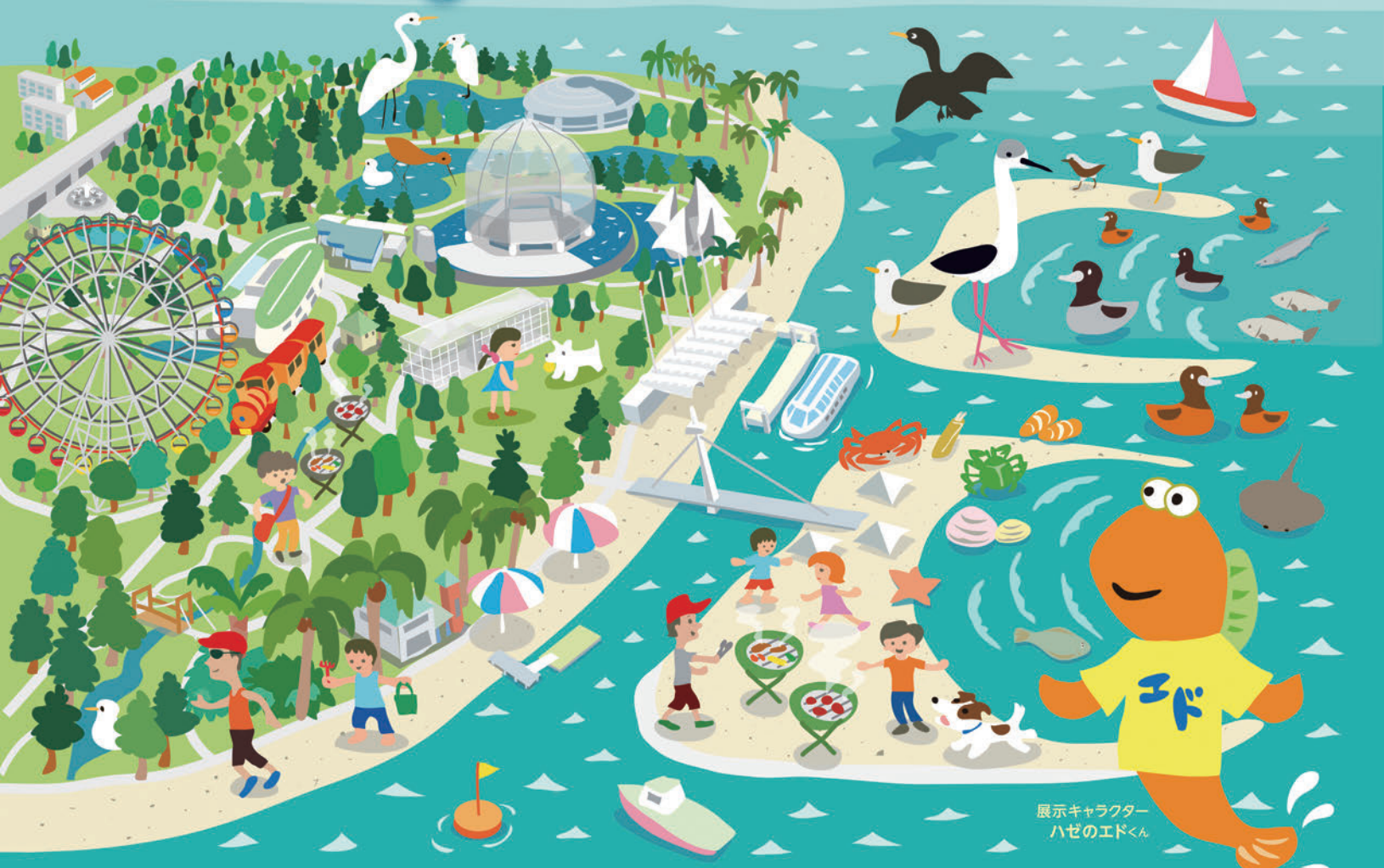
展示キャラクター ハゼのエドくん

主催：江戸川区・しのざき文化プラザ指定管理者篠崎SAパブリックサービス 協力：葛西臨海公園、葛西臨海水族園、NPO法人 生態教育センター、 ホテルシーサイド江戸川、谷口建築設計事務所、東京都公園協会 東京水辺ライン、認定NPO法人 ふるさと東京を考える実行委員会、船宿あみ井